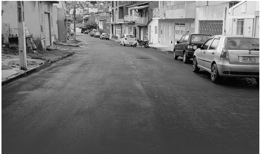
Depois de quase cinco décadas de espera, rua Ubaldino Mesquita Passos finalmente foi asfaltada

TRIBUNA REGIONAL JORNALISMO COM CREDIBILIDADE