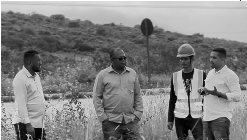
Organizadores esperam a participação ativa da comunidade para garantir continuidade da tradição

Na última quarta-feira (24), Jacobina recebeu a visita dos representantes da CBS Construtora Baiana de Saneamento LTDA, a empresa responsável pela construção do Hospital Regional Estadual.