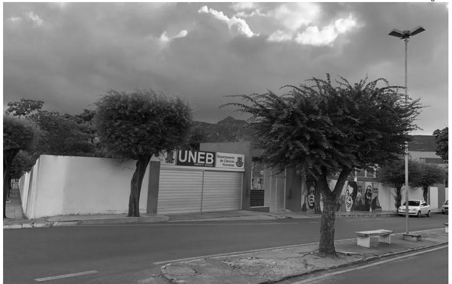
A imagem é meramente ilustrativa do Hospital Metropolitano

A notícia tem gerado uma expectativa bastante positiva, tanto na comunidade universitária quanto na sociedade jacobinense, que vê com bons olhos a chegada de mais um curso de medicina, abrindo novos horizontes para a formação de mais profissionais para o setor de saúde.