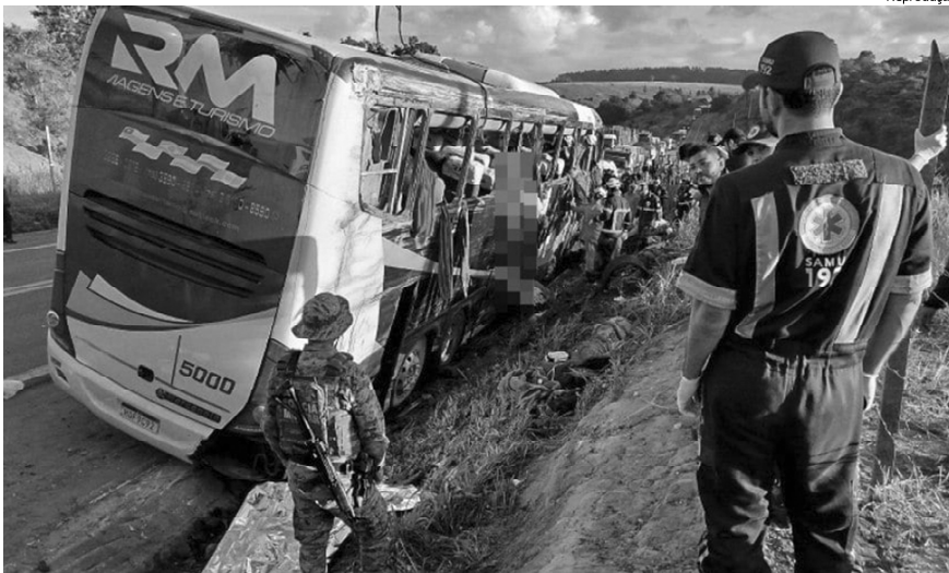
Segundo a PRF, o acidente aconteceu no km 885, em sentido ao distrito de Posto da Mata, em Teixeira

Oito pessoas morreram e 24 ficaram feridas após um ônibus de turismo bater em um barranco e tombar na manhã de quinta-feira (11), na BR-101, no trecho da cidade de Teixeira de Freitas, no extremo sul da Bahia. A informação foi confirmada pela Polícia Rodoviária Federal (PRF).