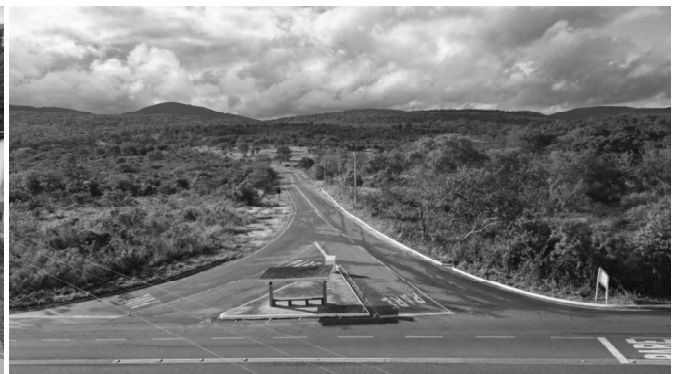
Entre outras obras, o governador inaugurou a unidade conjugada das Polícias Civil e Militar, e entregou a pavimentação do entroncamento da BA-131 ao distrito de Genipapo