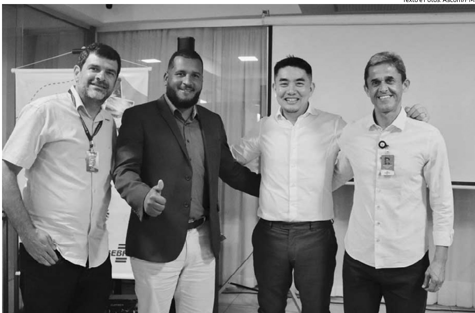
Prefeito agradeceu a todos que se envolveram, direta e indiretamente, na elaboração do Projeto

O Plano foi lançado pela Prefeitura em 17 de abril, em parceria com o Serviço Brasileiro de Apoio às Micro e Pequenas Empresas (Sebrae),