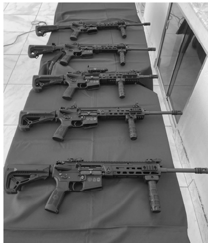
Entrega de novas carabinas cal. 5,556mm e de uma viatura semi blindada