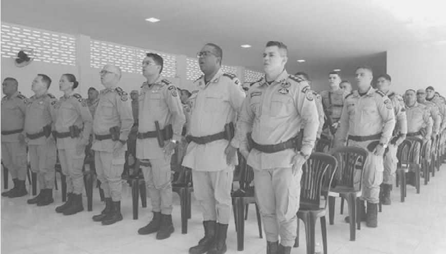
A 24ª CIPM, em Jacobina, sediou a Reunião de Comandantes da Região