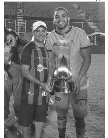
O jacobinense Nuna esteve no Barradão, em Salvador, durante a entrega da Taça da Série B ao Vitória