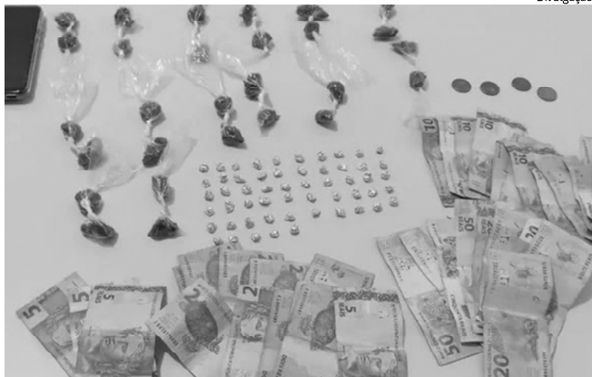
Foram encontrados porções de maconha, crack, dinheiro e um celular

No final da tarde de terça-feira (21), enquanto realizavam rondas no bairro Jacobina 4, a guarnição do 2º Pelotão da PM visualizou duas pessoas que passaram a agir de maneira suspeita e tentaram correr ao perceberem a aproximação da viatura policial.