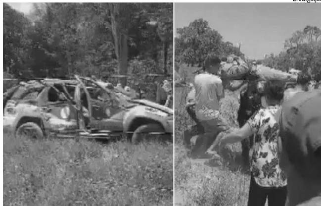
Um policial ficou preso entre às ferragens e precisou ser resgatado

Dois policiais militares ficaram feridos após a viatura em que estavam capotar durante uma perseguição a um carro na BA-274, na zona rural da cidade de Canavieiras, no sul da Bahia, na tarde de quarta-feira (22).